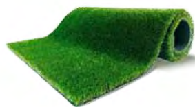
T-Turf S9 Revolution

Die T-Turf Generation steht für ein authentisches Spiel- und Ballverhalten, verbunden mit naturnaher Optik und einer bisher unerreichten Lebensdauer. Im Rahmen von SPORTISCA TPS stehen folgende Rasenprodukte zur Wahl: